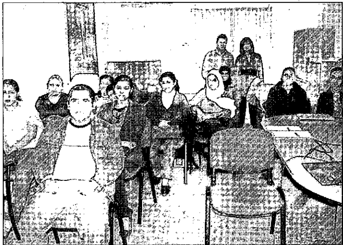
Participantes en el seminario organizado por el Centro de la Mujer.