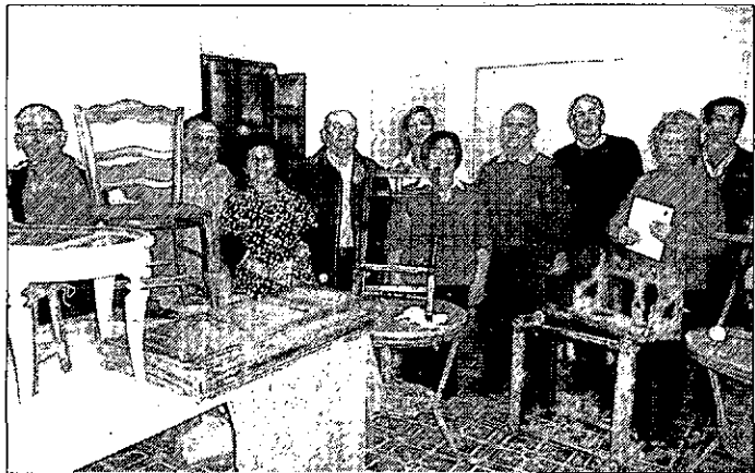
Taller de reparación de muebles. El taller de reparación y restauración de muebles del Ayuntamiento concluyó sus clases con la participación de catorce alumnos, jubilados o pensionistas de la localidad. Durante 50 horas mejoraron el aspecto de muebles y utensilios de madera de todo tipo, recuperando viejos objetos olvidados, que se volverán a reutilizar.