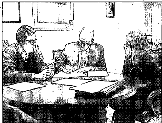
Un momento de la firma del convenio entre el Consistorio y Caja Rural.

Caja Rural de Ciudad Real cerró los tres primeros trimestres del año con unos beneficios de 10,8 millones de euros, un 20% más del objetivo fijado para todo el año.