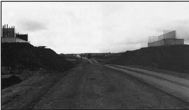
La variante de la N-430 estará lista para el verano. Imagen de la nueva estructura de puente tras la modificación de la obra.