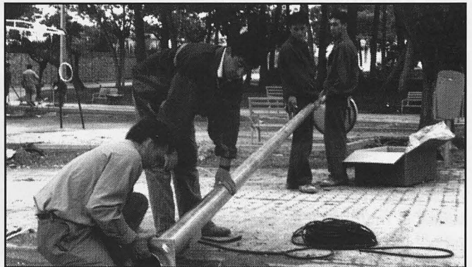
El parque municipal está cambiando sus bancos y colocando nuevas farolas.