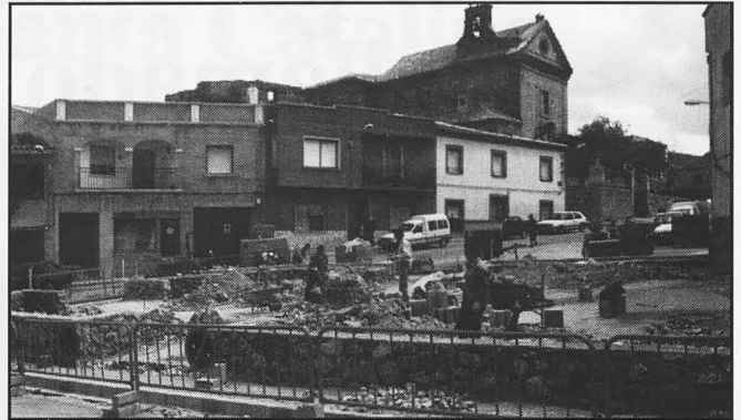
La explanada del convento está cambiando totalmente. Un nuevo jardín dará otro aire al lugar.

Como las bicicletas, las obras también son para el verano. Es de suponer que todas estas estarán finalizadas para el ya cercano estío. Árboles, plazoletas, acerados, edificios, monumentos, zonas verdes... tendrán una nueva cara dentro de poco. GACETA deja constancia gráfica de aquellas áreas o rincones que están cambiando su fisonomía.