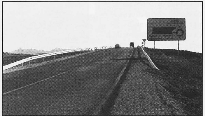
El puente de la carretera de Valdepeñas, ya habilitado, absorberá gran parte del tráfico.