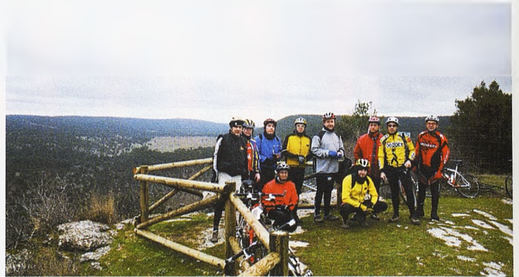
Mirador de El Ceño, una balcón natural sobre Tierra Muerta, que recientemente ha sido arreglado y señalizado como itinerario de pequeño recorrido (PR).

La bajada tiene mucho barro y de momento no es adecuada ni para coche todo-terreno. Después nos metemos por una senda sobre la roca caliza, para posteriormente entrar literalmente en el Arroyo de La Rambla. Las sendas se con-