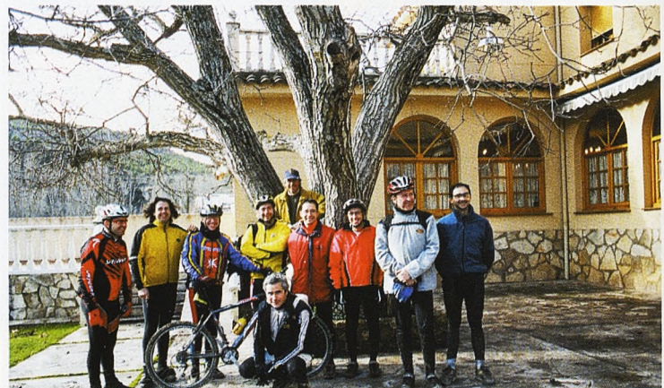
En Palomera nos esperaban unas buenas gachas con tocino, lomo y chorizos, sin duda mejor que las típicas barritas energéticas que solemos usar y que nos dejan satisfechos.

funden con el pedregoso arroyo y es inevitable que, de vez en cuando, alguno tenga que mojarse los pies.