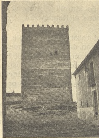
La ingente torre del homenaje del castillo.