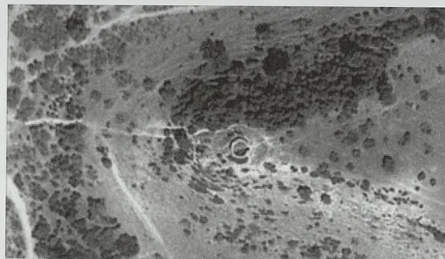
Fig. 10. Torre de El Bujedillo

El Castillo de Fatetar (fig 12 y 13) fue construido sobre un cerro en altura en la campiña alta (fig 14), y domina visualmente la zona hacia Jerez y Sevilla. La fortaleza actual tiene origen musulmán, construyéndose en