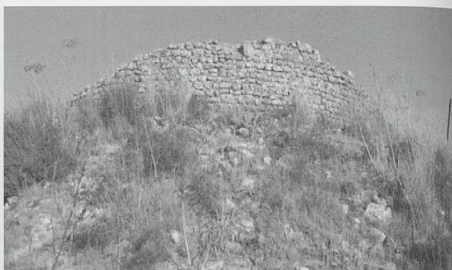
Fig. 11. El Bujedillo

914, siendo conquistado por los cristianos hacia 1264, con restos visibles de alguna construcción anterior, posiblemente tardorromana o visigótica, aunque también han aparecido restos de época romana altoimperial. La cerca amurallada es de planta irregular muy reformada, conservándose una gran torre del homenaje, de planta cuadrada y ángulos exteriores achaflanados con un aljibe excavado en la roca en su interior. En época Moderna se le adosó una ermita, para el culto al Santo Cristo. Destacan un gran aljibe cubierto por bóveda de cañón, un dintel decorado con tres estrellas de seis puntas posiblemente visigóticos, un arco lanceolado y el alfiz posiblemente islámicos en vanos ciegos.