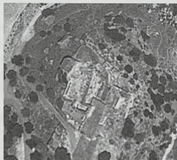
Figs. 12 y 13. Castillo de Fatetar. Espera

914, siendo conquistado por los cristianos hacia 1264, con restos visibles de alguna construcción anterior, posiblemente tardorromana o visigótica, aunque también han aparecido restos de época romana altoimperial. La cerca amurallada es de planta irregular muy reformada, conservándose una gran torre del homenaje, de planta cuadrada y ángulos exteriores achaflanados con un aljibe excavado en la roca en su interior. En época Moderna se le adosó una ermita, para el culto al Santo Cristo. Destacan un gran aljibe cubierto por bóveda de cañón, un dintel decorado con tres estrellas de seis puntas posiblemente visigóticos, un arco lanceolado y el alfiz posiblemente islámicos en vanos ciegos.