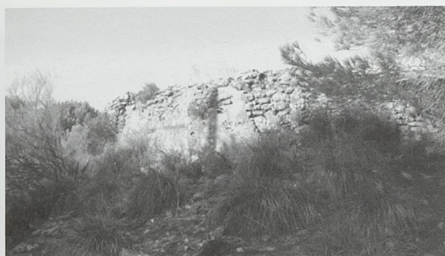
Fig. 9. Torre de El Fuerte

del Calvario, es de planta circular con 9 metros de diámetro interior en su base y manteniendo 1,90 metros de la altura original ataluzada de los muros enfoscados con mortero de cal (fig. 9). Se ejecutó con mampostería irregular careada de 1,60 metros de espesor en su base, tomada con mortero de cal en dos roscas de unos 45 cms de espesor y núcleo relleno de mampuesto y mortero. El lugar está colmatado de material constructivo como ladrillos macizos de 24x14x5 cms con capas de mortero de cal de unos 3 cms de espesor. Presenta a modo de troneras en el muro restos de huecos orientados hacia las poblaciones de alrededor.