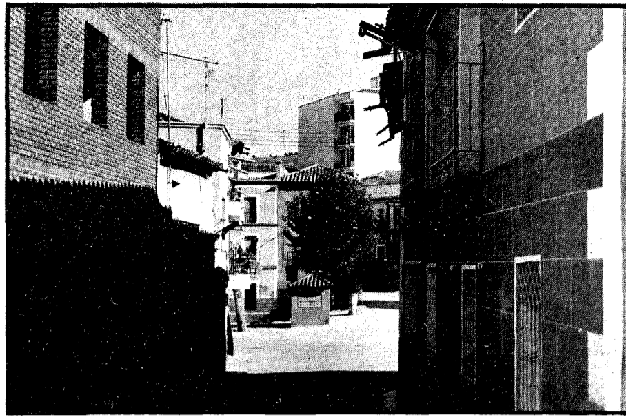
Otra bonita perspectiva de una calle.