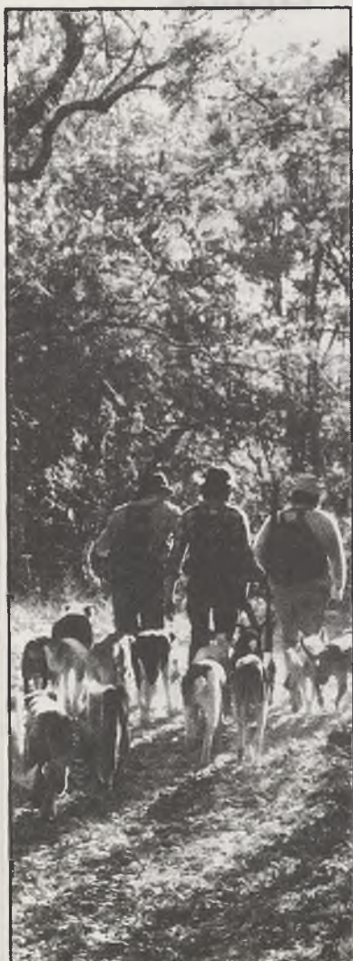
Los perros pieza fundamental en la caza

El consejero argumentó en apoyo a estas afirmaciones sobre la prohibición de caza de aves en período de reproducción, que es ésta una cuestión que preocupa al Gobierno Regional, tanto que en los últimos 6 años se ha declarado 12 refugios de aves acuáticas en distintos puntos de la geografía regional.