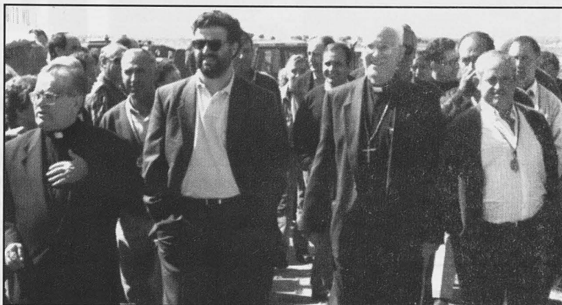
El Obispo con las autoridades locales a su llegada