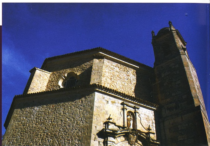
Iglesia de San Pedro

soportar la ansiedad de la espera, hemos emprendido nuestro particular "vía crucis" por las iglesias donde se guardan nuestros pasos. Con ello hemos realizado, seguramente de manera inconsciente, un recorrido por los monumentos más valiosos de nuestra ciudad, contemplando un compendio de la arquitectura y el arte desde la edad media hasta nuestros días, desde el siglo XII hasta el siglo XX.