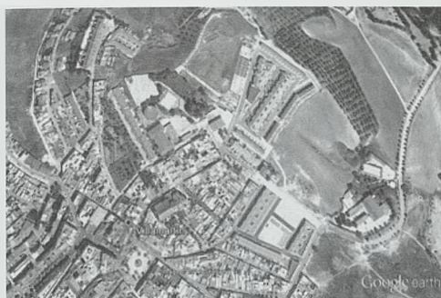
Fig. 15. Zona de Torrevieja. Villamartín