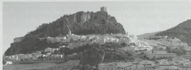
Figs. 17 y 18 Castillo de Zahara de la Sierra

reconquistar en 1481, convirtiéndose en el "casus belli" de la Guerra de Granada. Don Rodrigo Ponce de León la conquistó definitivamente en 1483,