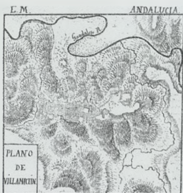
Fig. 16 Plano de Guadalete a su paso por Villamartín

to del 2º Regimiento de Húsares 9 La ermita anexa fue utilizada con fines militares por los franceses, información que se corrobora en el Archivo Parroquial 10 .