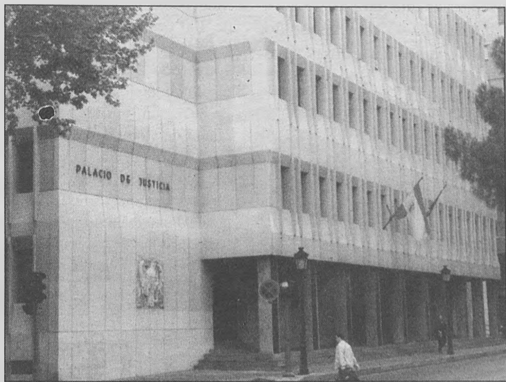
El Tribunal Superior de Justicia de Castilla-La Mancha (en la imagen) ha fallado a favor del Ayuntamiento manzañareño.

Según señaló Pozas, de los temas que había que dilucidar en el recurso, a su juicio, ha quedado claro que la tasa establecida sobre el agua "está ajustada a derecho, que ha sido bien calculada por los servicios técnicos, que no