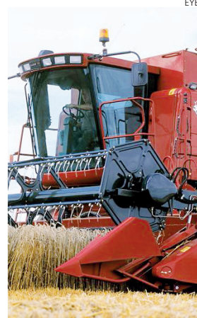
La maquinaria agrícola, es de lo que más se roba.

El dirigente político se refirió a la seguridad en nuestros agricultores y ganaderos que se está viendo muy atacada en los últimos años por "una proliferación de actuaciones delictivas en el ámbito rural que tiene como objeto el robo de diferentes tipos de maquinaria instalada en explotaciones agrarias y ganaderas.