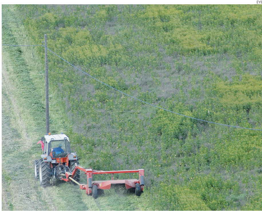
Sólo en el sector vitivinícola Agroseguro tuvo que abonar 40,7 millones de indemnización.

Los cultivos más representativos de la región presentaron novedades en los seguros