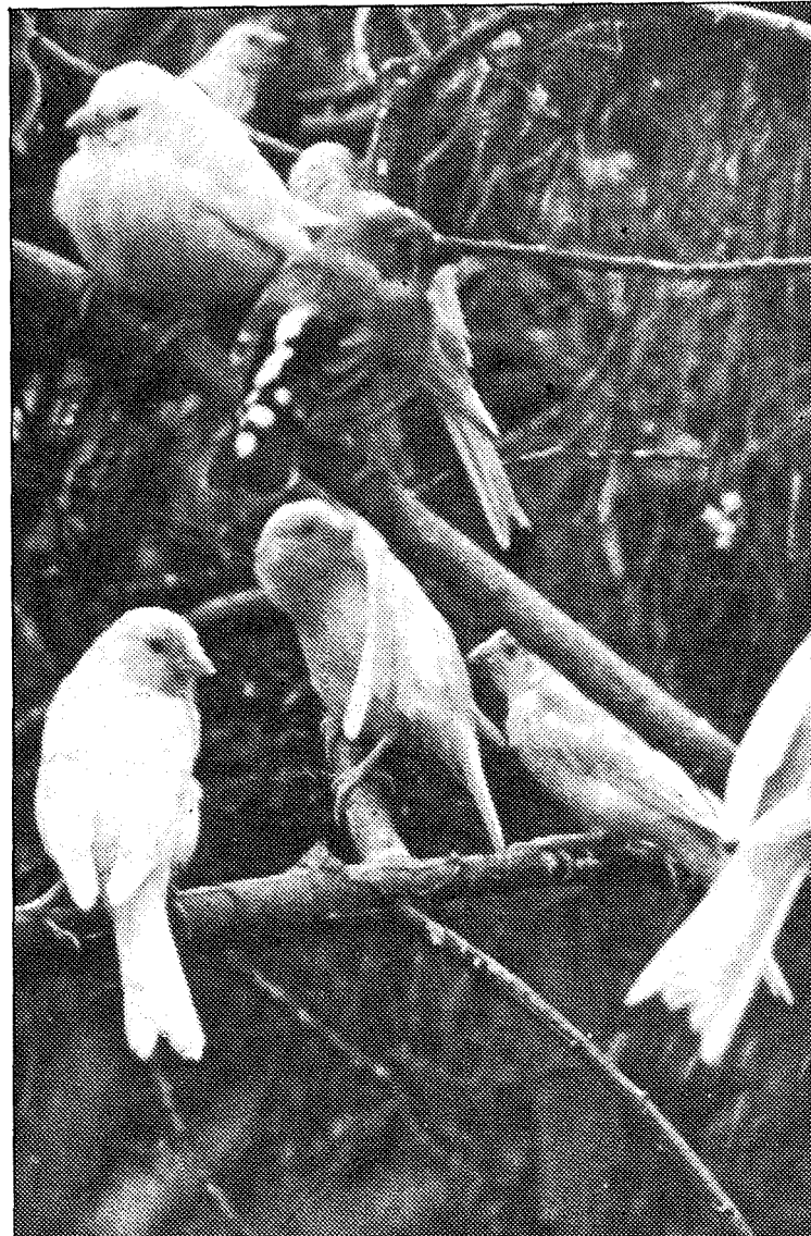
Pajaros como estos se pueden observar en la exposición-concurso.

Como dice el dicho «De Toledo pescador o pajarero».