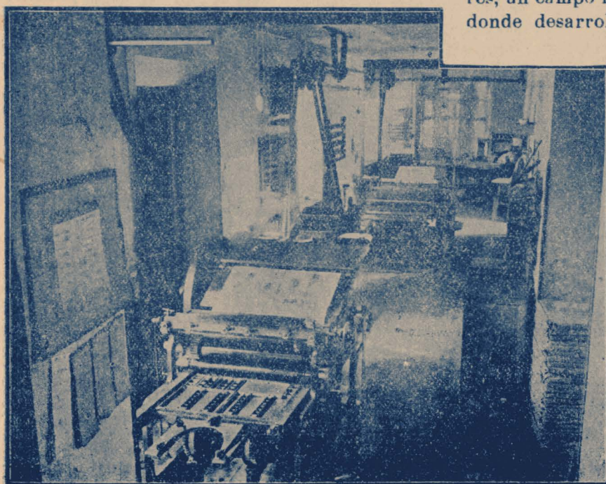
Vista parcial de las máquinas