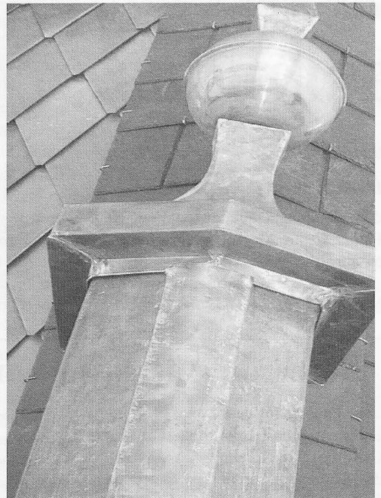
Detalle de uno de los ocho pináculos.