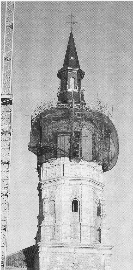
Plano general del nuevo chapitel.

El caso es que, tras una reunión en La Solana, la empresa contrató nuevos plomeros que ya están terminando el chapitel. Si no se producen contratiempos, la obra debe estar concluida este mes de marzo. Naturalmente, tal previsión está sujeta a las inclemencias del tiempo por razones obvias.