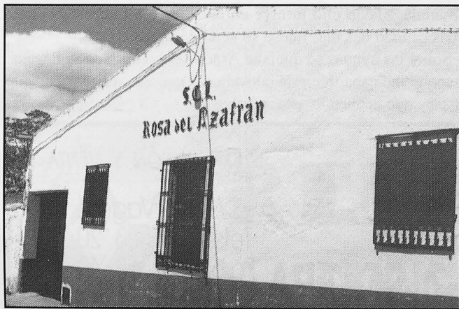
Fachada de la cooperativa del pan “Rosa del Azafrán”.