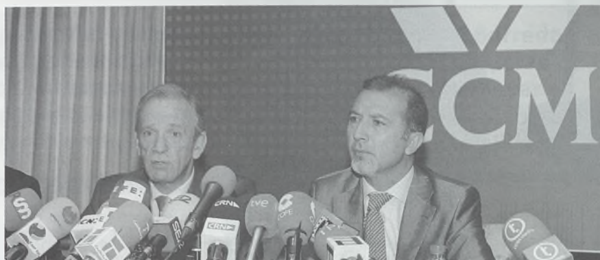
PRESENTADO EL PLAN DE GESTIÓN A LO DIRECTIVOS

La creación de nuevas empresas en Castilla-La Mancha recuperó algo de ritmo en noviembre de 2009, cuando -y según los datos del INE- se constituyeron en la región 282 nuevas empresas, con un capital suscrito global de 46.423.000 euros. En ese mismo mes se cerraban 46 empresas en el territorio regional. En la provincia de Toledo se constituyeron 95 empresas, con un capital total desembolsado de 4.878.000 euros. Durante el mismo periodo se disolvieron tres sociedades.