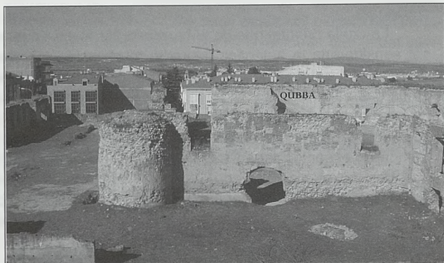
Vista general desde el suroeste

el salón. El mejor paralelo que hemos encontrado es el famoso Salón de los Concilios del palacio arzobispal de Alcalá de Henares en el que podemos ver la misma solución de vanos abiertos en fachada, a la vez que nos informa de los tipos de armaduras que debieron de cubrir estos espacios, especialmente la interesante solución ochavada con la que se cubrieron sus alhanías.