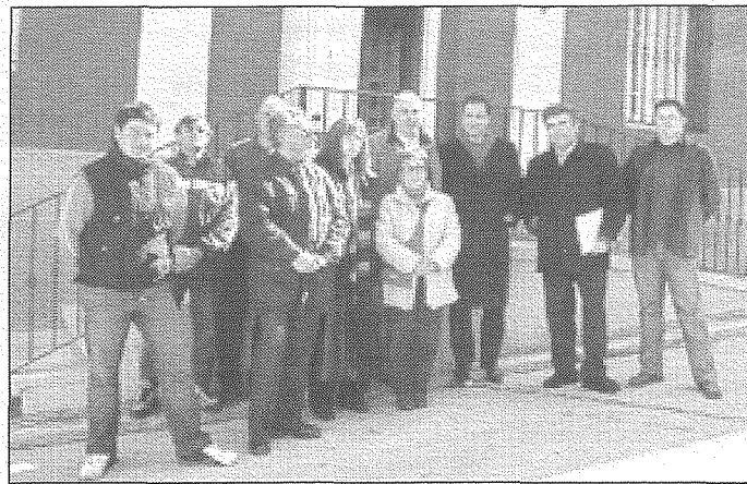
El director general de Industria y Energía, José Manuel Martínez, durante su visita al municipio conquense de Talayuelas, donde se reunió con el alcalde y la Corporación Municipal.

El director general de Industria y Energía, José Manuel Martínez García, visitó los pasados días la localidad conquense de Talayuelas para reunirse con su alcalde, Eliseo Martínez, y la Corporación local con el fin de tratar la calidad de suministro de energía eléctrica.