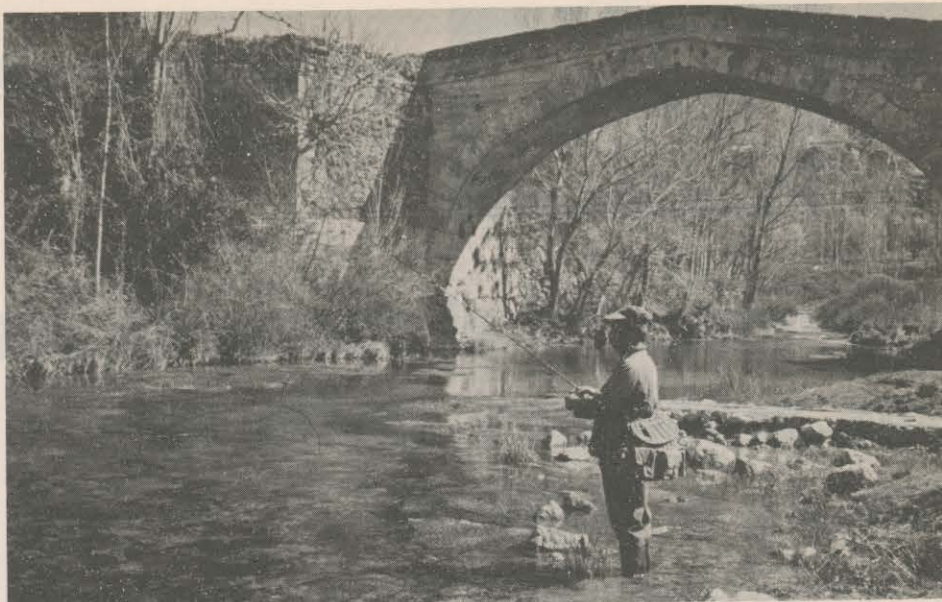
UNA RIQUEZA NATURAL MAL EXPLOTADA

Conscientes de las dificultades que encierra la ordenación adecuada de nuestros ríos, para la práctica de la pesca deportiva, nos hacemos eco de las inquietudes de los pescadores, que demandan soluciones a corto plazo, ante la amenaza de pérdida de una riqueza difícil de reponer. ●