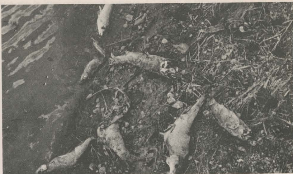
NUNCA HAY EXPLICACIONES SOBRE LOS PECES MUERTOS