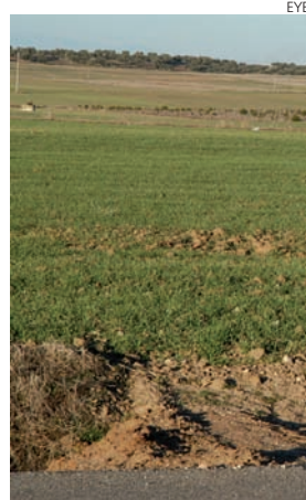
El medio rural está expectante.

Por todo esto, Asaja de Cuenca insiste en que el medio rural necesita, ahora más que nunca, que se mantengan estas partidas europeas que tienen como ejes objetivos tan importantes para la región como la creación de infraestructuras hídricas, la mejora de las redes ferroviarias y de ca-