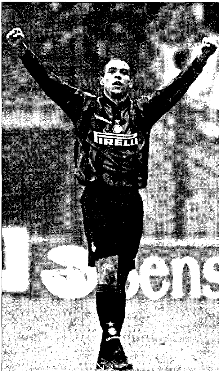
ESTRELLA Ronaldo celebra su tanto, que acabó con la imbatibilidad del Parma.

La Juventus goleó al Udinese (4-1) y ya es segunda