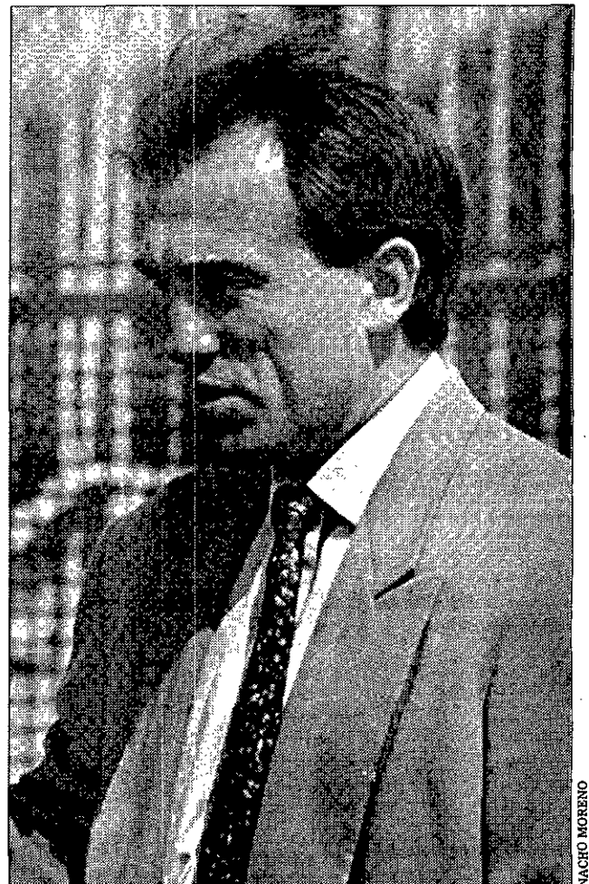
CERCENADO Hidalgo reemplazó a Goikoetxea en el banquillo salmantino.

Parece claro que cuando un equipo no tiene hechas de Primera División, es indistinto quién lo entrene. El Sporting es último y parece imparable hacia el descenso.