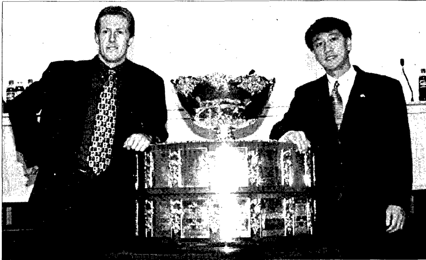
PRECIADA El sueco Jonas Bjorkman, a la izquierda, y el estadounidense Michael Chang posan junto a la Copa Davis momentos después de que se realizase el sorteo.