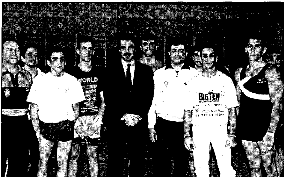
VISITA ILUSTRE José María Aznar visitó ayer la residencia Joaquim Blume y compartió mesa con los deportistas.

posición en la globalidad de aparatos en los Mundiales de Lausana, además de la medalla de oro en barra fija en la Copa del Mundo, sufrió en el calentamiento de los Campeonatos de España una tendinitis en la rodilla izquierda,