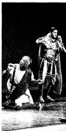
Obra del año pasado.