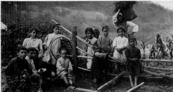
FELIPE MANTEROLA. Grupo de niños en Undarraga . Zéanuri, 1913. (Archivo Manterola. Instituto Labayru Ikastegia).

Esta exposición es la segunda parte de un proyecto asumido por el Ministerio de Cultura en 1989, con motivo del 150 aniversario de la invención de la fotografía.