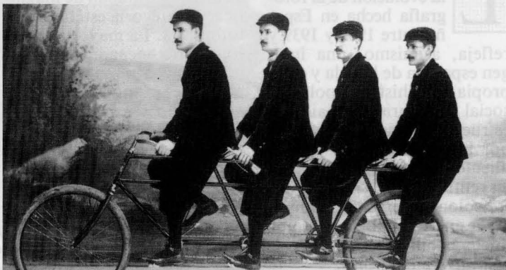
AUDOUARD. Cuatrillizos en un tándem de cuatro plazas . Barcelona, hacia 1905.