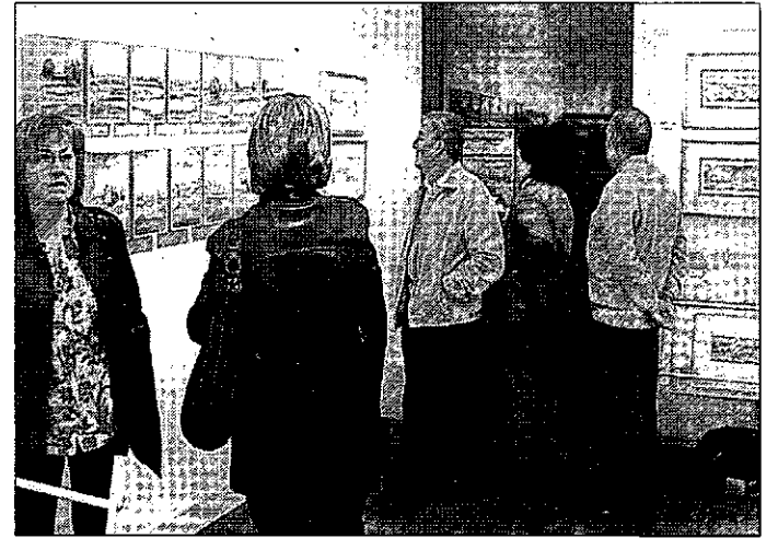
Un grupo de vecinos visitan la exposición de Vaquero.

La exposición que permanecerá en la galería Marmurán hasta el próximo mes de diciembre, permite conocer la visión que Ángel Vaquero tiene de paisajes como los anchos o las lagunas (de las que dice que ahora merece la pena visitar), una colección de horizontes que no van a decepcionar al visitante.