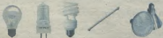
Comparativa de los diferentes sistemas de iluminación.