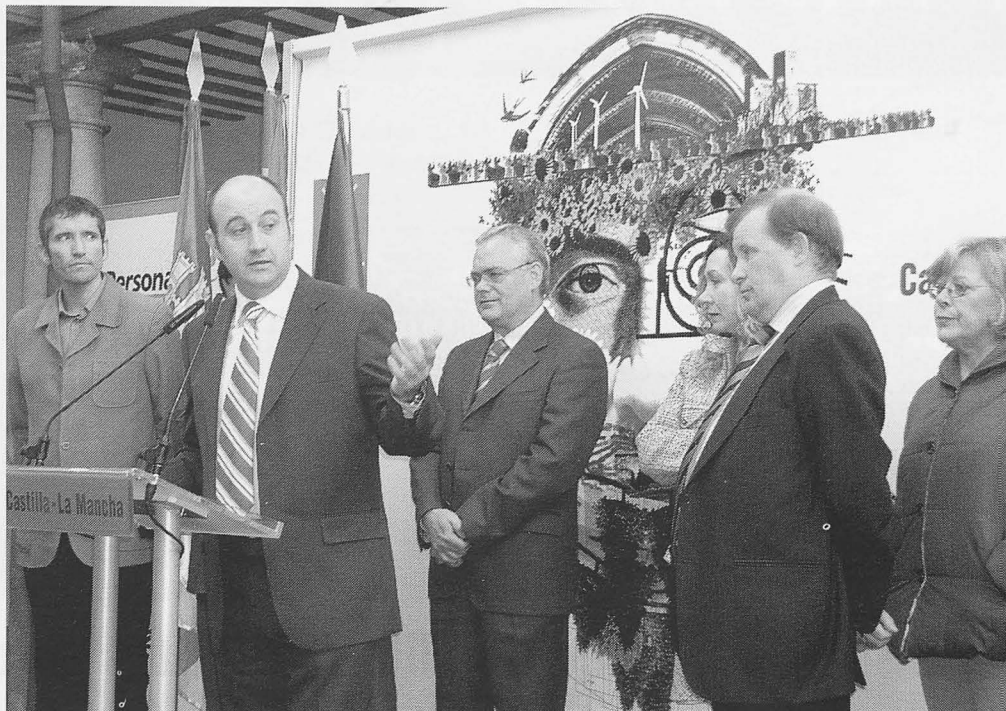
Momento de la presentación del proyecto.

Cree que son necesarias aunque reconozca que “a ningún mayor le gustaría salir nunca de su casa para que lo cuiden, pero los hijos no tenemos tiempo para ellos, sólo trabajamos y queremos vivir cada día me-