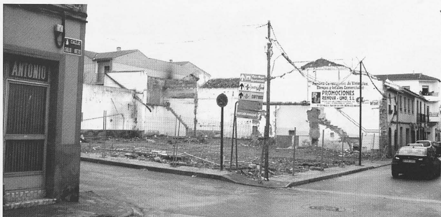
Solar donde siempre ha estado la bodega de "Los pelliceros".

como la bodega de los Hermanos Alhambra, en la calle Emilio Nieto, se mantuviera. Pero, si miramos atrás, la memoria nos hará viajar por tantas y tantas