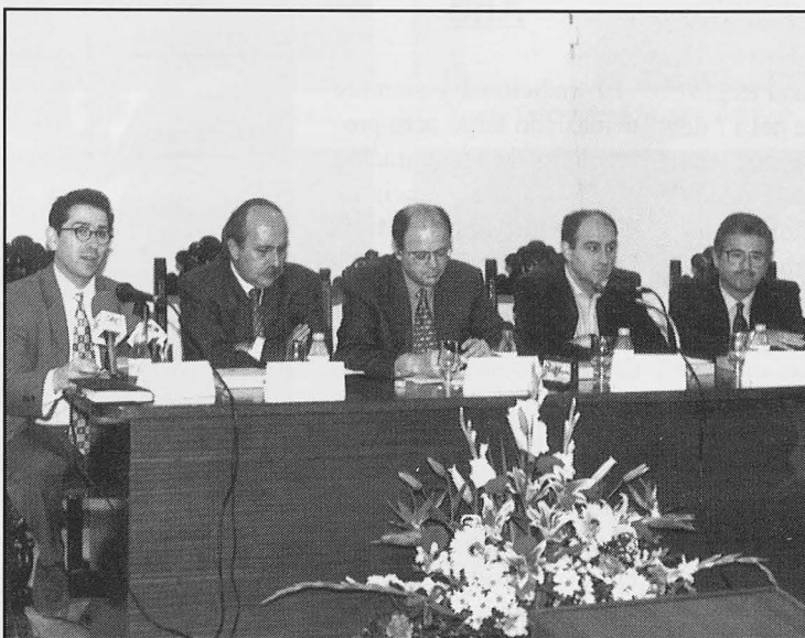
Mesa Presidencial en la inauguración del Seminario.

Posteriormente se desarrollaron las diferentes ponencias, aunque la primera de ellas se modificó de la