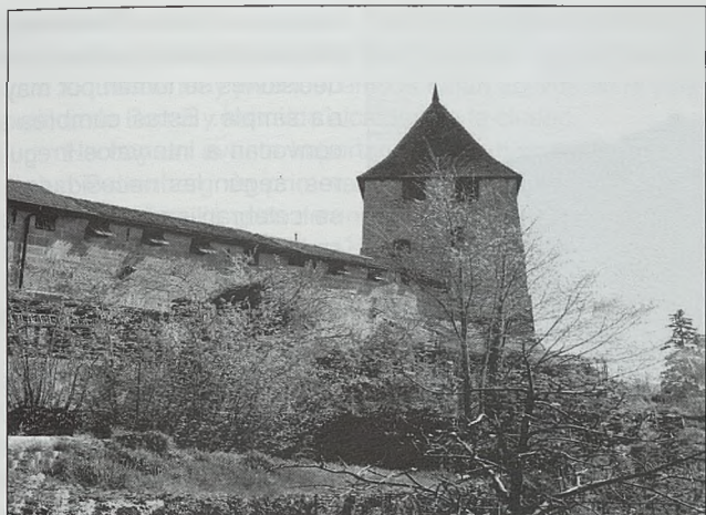
Exterior de las murallas de Murten