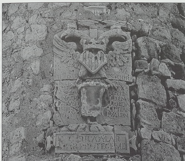
Escudo del duque de Maqueda, virrey del reino de Valencia, en la torre de Almadún. Peñíscola