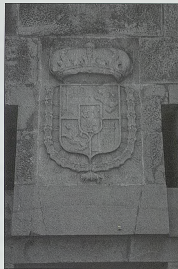
Escudo de Felipe V, con el año 1742, en el fuerte de Moraira. Teulada

Según la relación de Tomás Boscasa en 1728 la defensa del litoral valencia-