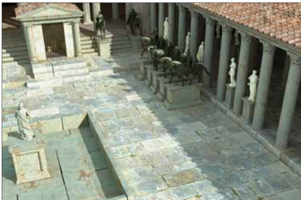
Imagen virtual del patio del foro de Segóbriga con esculturas de caballos.

De este lugar procede una rica serie de capiteles que pertenecieron al edificio original y que fueron reemplazados en construcciones posteriores en época tardorromana y visigoda.