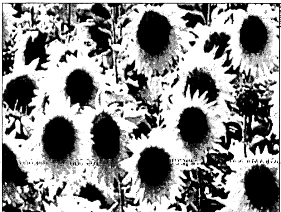
Las organizaciones agrarias ven necesarias nuevas ayudas para el girasol.

La medida tendría un efecto de 91.048 millones en la región en seis años