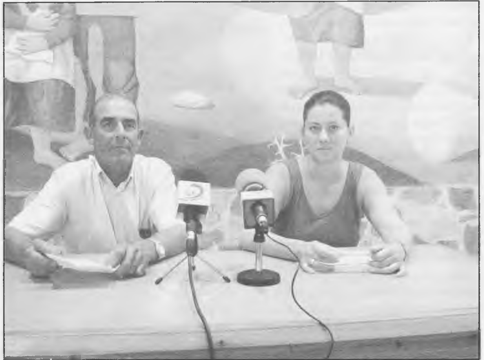
Responsables de la Comisión de Medio Ambiente

Una comisión denominada "Calidad Ambiental y Salud Pública", ha sido constituida durante el mes de agosto en la reunión de la comisión de Gobierno del Ayuntamiento de Daimiel, y está destinada a analizar los temas y asuntos que de alguna manera tengan que ver con la agricultura, los jardines (de los cuales resaltó que nuestro municipio está bien dotado, y es por ello motivo de comentarios admirativos por parte de los visitantes) y la Agenda 21, está relacionada con la cumbre mundial medioambiental de Río de Janeiro, el desarrollo sostenible, el estudio de la situación a estos respectos a nivel municipal, etc.