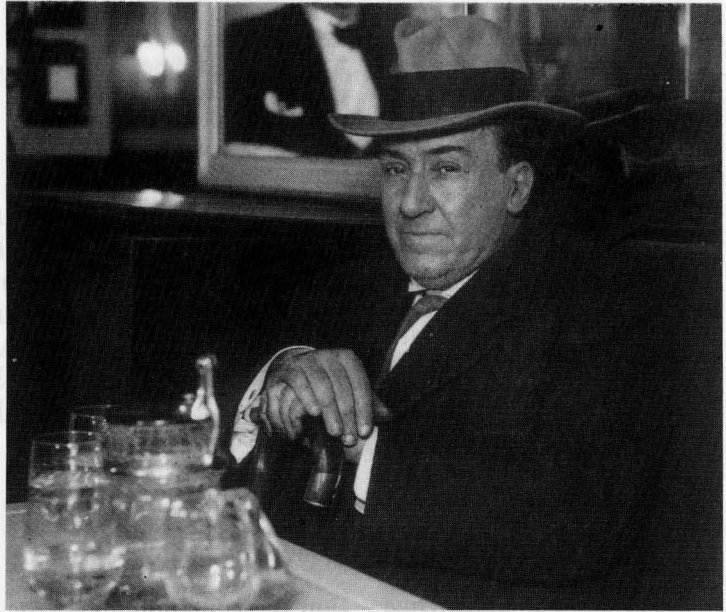
ALFONSO SÁNCHEZ PORTELA. Don Antonio Machado en el café de las Salesas. Madrid, diciembre de 1933.