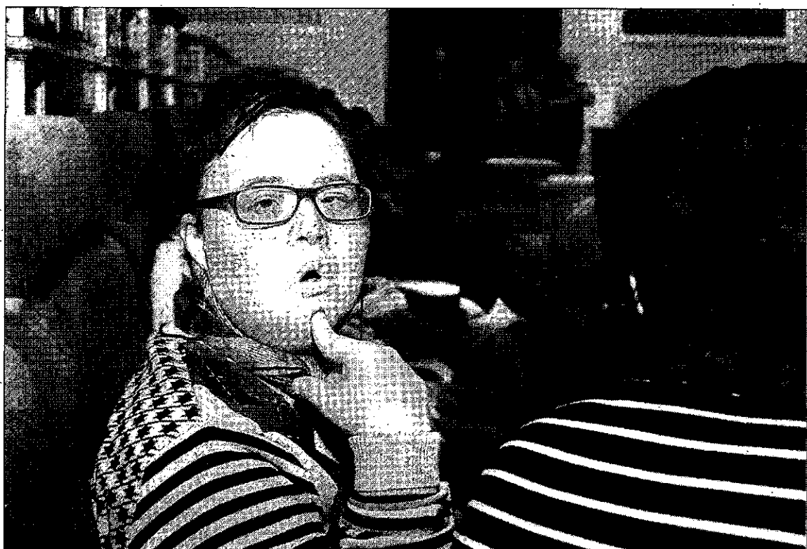
Las Cortes aplazaron su tradicional pleno de los jueves para abrir sus puertas a las personas con discapacidad.