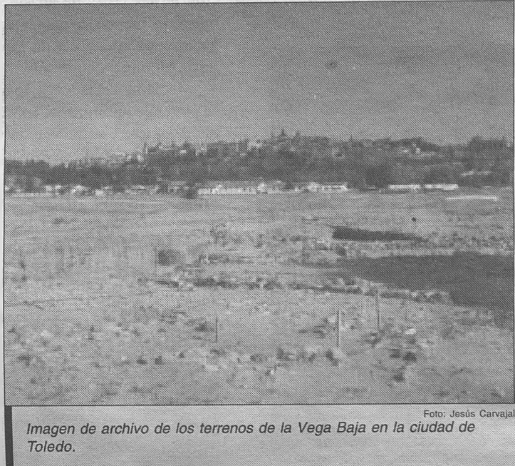
Imagen de archivo de los terrenos de la Vega Baja en la ciudad de Toledo.