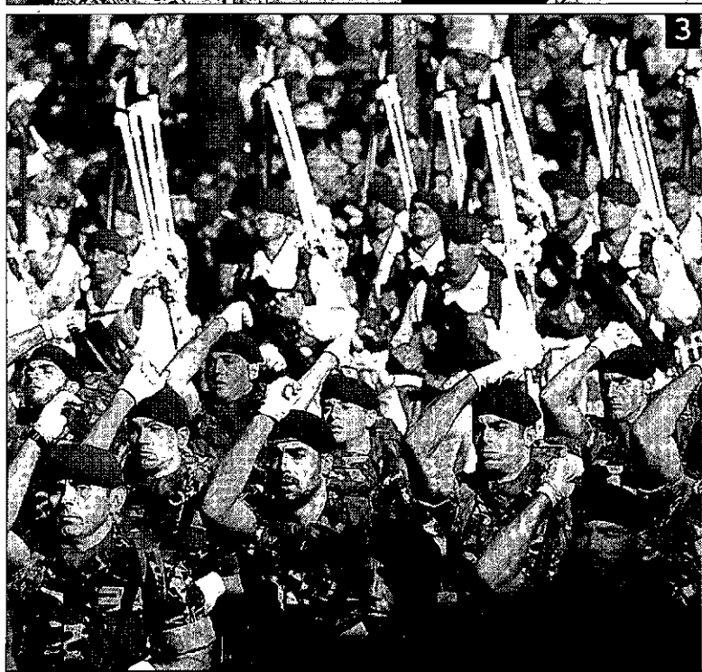
1. Un tanque recorre el centro de Madrid ante la expectación del público. Estos vehículos suelen ser los más esperados por los asistentes. 2. La Princesa de Asturias acaparó las miradas en la recepción real. 3. Cientos de militares de 36 destacamentos se dieron cita en el desfile. 4. Las aeronaves realizaron espectaculares acrobacias.