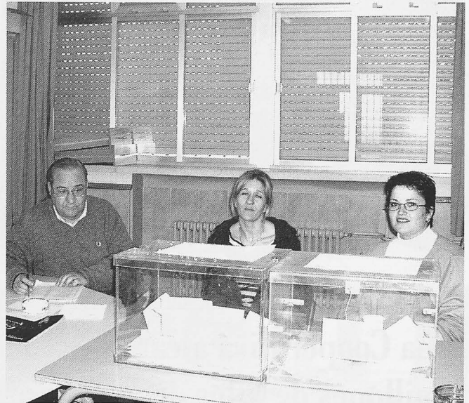
Votaciones en los colegios Sagrado Corazón (izquierda) y El Humilladero.