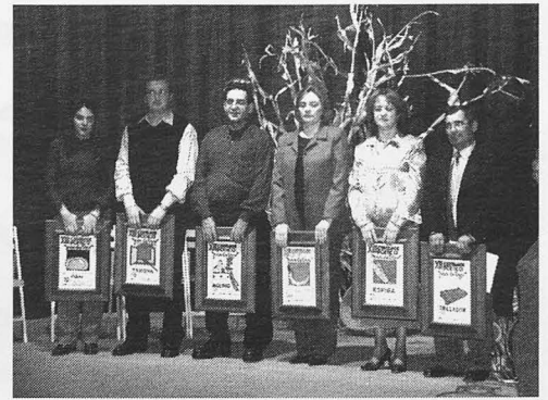
Autores premiados con sus galardones.

concluyendo con los propios Pan de Trigo, y ensalzó la importancia que tienen la poesía y la literatura en un mundo que idealiza otros intereses. El broche del acto lo puso la coral Quercus Robur, de Villarrobledo, una de las pocas corales de voces graves de la región. Bajo la dirección de Rafael Lodaes, sus 12 componentes interpretaron seis temas, muy aplaudidos por el público, que no llenó el auditorio.