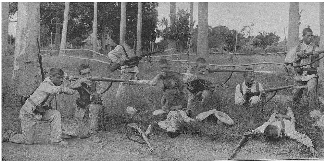
GUERRA DE CUBA. - SARGENTO DE SIGÜENZA EN EL COMBATE DE CEJA DEL TORO Y DEFENSA DEL CONVOY DE VIÑALES