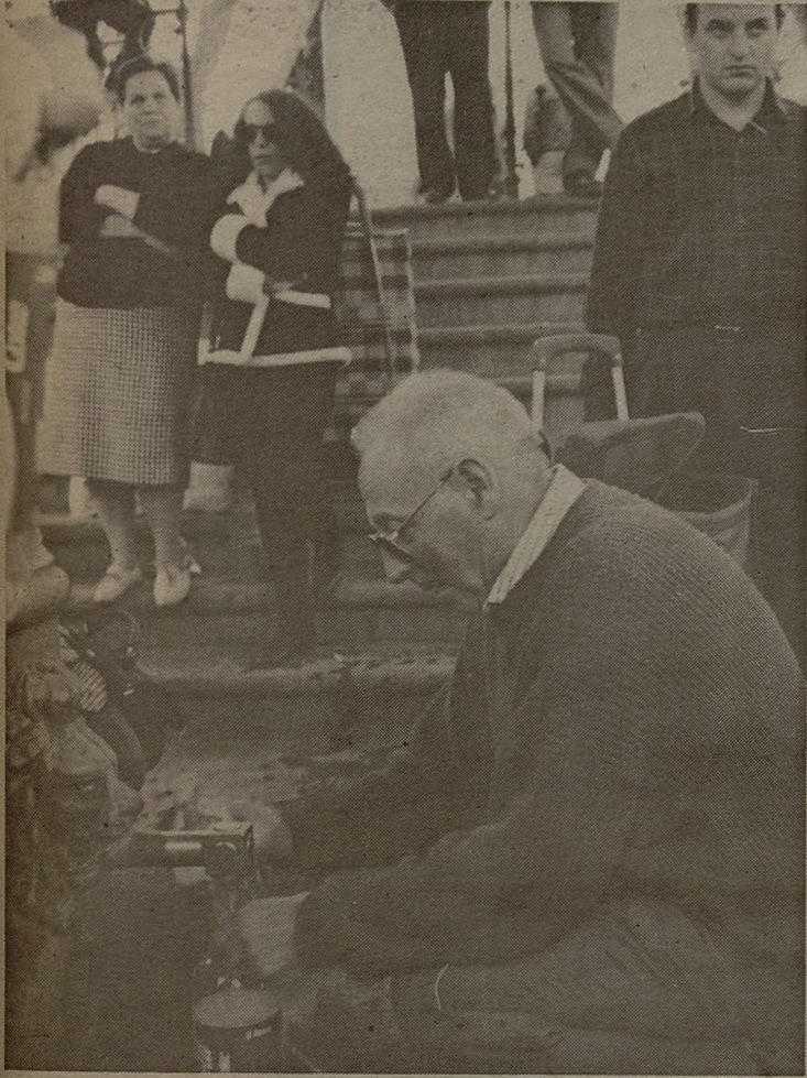
LA FUENTE DE AGUA AGRIA. No se trata de un personaje propiamente dicho, pero su presencia es algo permanente en la ciudad como testigo de las historias y andanzas del resto de personajes que pasan por esta localidad.

Forman parte de la vida cotidiana de la ciudad