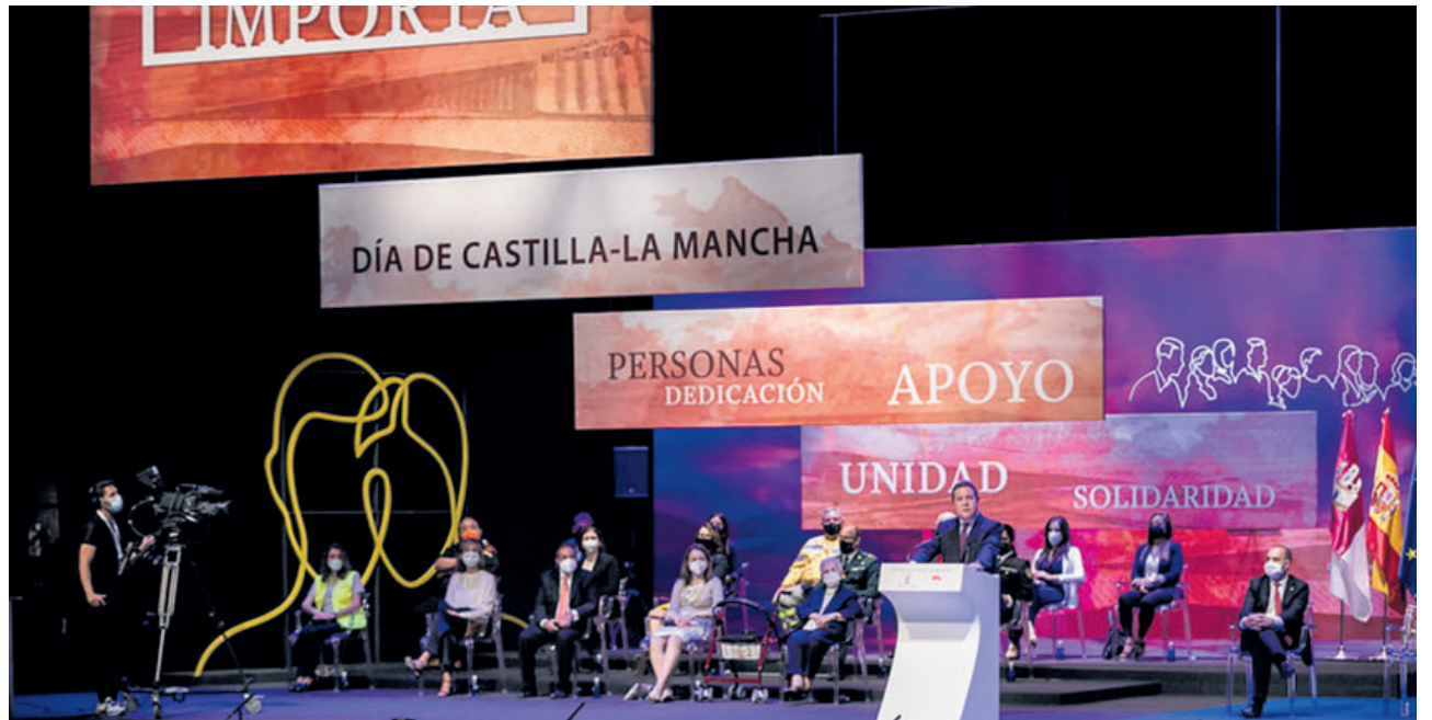
Emiliano García-Page interviene ante todos los reconocidos en el Día de Castilla-La Mancha detrás

Pedro Piqueras ha seguido a Perales en el uso de la palabra y también le ha brindado agradecimiento y honores: «También para mí esto es un reconocimiento de corazón a corazón. Enhorabuena José Luis», le ha dicho antes de