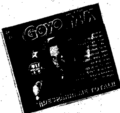
Goyo Mix "Desparame Total"