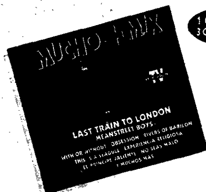
Mucho + Mix "Varios"