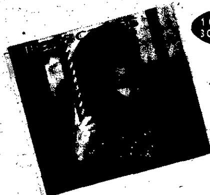
Maria Callas "The great Maria Callas"