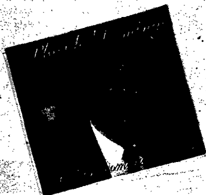
Plácido Domingo "Celebri romance da opere"