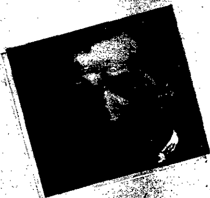
Giuseppe Verdi - Richard Wagner "Golden Classics"