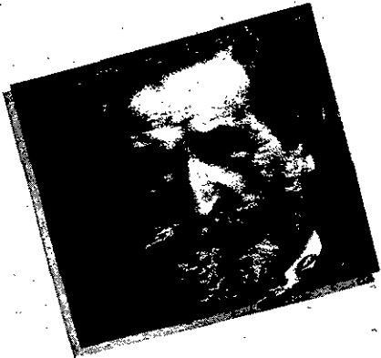
Giuseppe Verdi - Richard Wagner "Golden Classics"