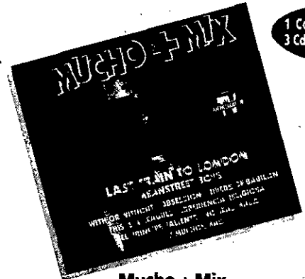
Mucho + Mix "Varios"