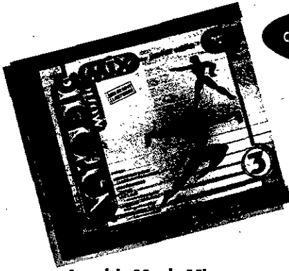
Aerobic Music Mix "Volumen 3"