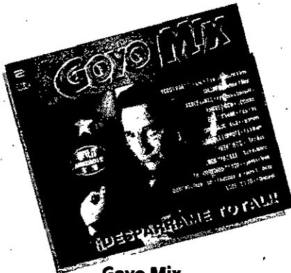
Goyo Mix "Desparrame Total"