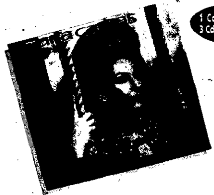
Maria Callas "The great Maria Callas"